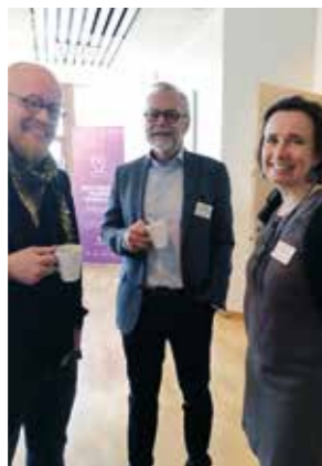
Efter seminariet fanns utrymme för mingel.

PIERRE SCHORI gjorde en utblick över världen, vad som förändrats sedan kalla kriget och vad som hotar mänskligheten i dag. Han menade att om man vill stötta fred och utveckling i ett land i konflikt, behöver det finnas en tillräckligt stor grupp människor inne i landet som man kan jobba tillsammans med för att det ska fungera. Anders Arborelius pratade